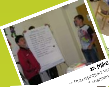
27. März -- Praxisprojekt vor so spannend!