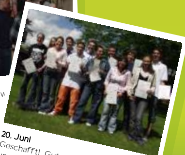
20. Juni Geschafft! Gut dass die meisten von uns auch weiterhin zusammenarbeiten!